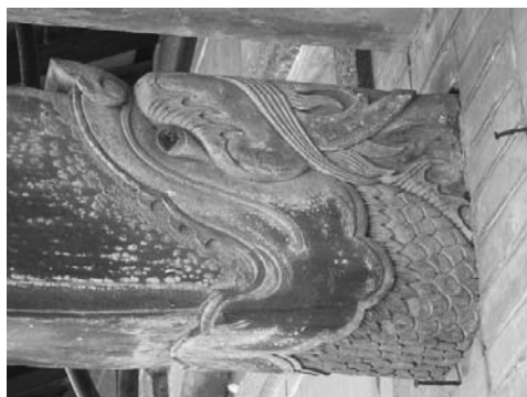
圖 12、萬巒鄉五溝村鍾屋夥房斗拱：龍紋