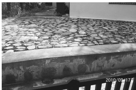
圖 4、客家傳統建築的化胎及五 星石

客家民居門楣上的堂號是每一姓氏的淵源，也是每一姓氏的代稱。客家人在祖堂或祠堂掛起祖先的堂號，視為光榮的標記，表明木本水源之所自，藉以緬懷先祖之創業垂統，以光前裕後。棟對是記載該姓氏家族的發源、祖籍以及遷移的過程，以及對後世子孫的訓示，其目的是要子孫能夠謹記祖宗言，也是祖先對後代的傳承與具體的交流。由客家夥房建築裝飾中的「堂號」與「棟對」，可以尋找各姓氏的起源，這顯示出客家人有著強烈的根源意識。客家祖堂或祠堂的存在是將有形的歷史展現於後人面前，透過堂號、堂聯、棟對等色彩鮮明的崇祖符號，維繫了家族制度，彰顯了慎終追遠的文化精神內涵。其次，位於祖堂或祠堂入口兩側牆面的窗櫺上方，以書卷圖案上有期許、勉勵的字詞做為窗額裝飾，如萬巒鄉泗溝村張屋窗額文字裝飾（圖 5）。書卷窗額型式多樣，有些會施以彩繪，如萬巒鄉五溝村萬成祖堂的書卷彩繪（圖 6），或是以泥塑方式呈現，如麟洛鄉麟蹄村邱屋在其祖堂牆面上，書卷窗額裝飾砥礪字詞（圖 7）。