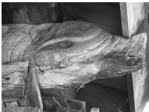
圖 11、萬巒鄉五溝村鍾屋夥房斗拱：大象