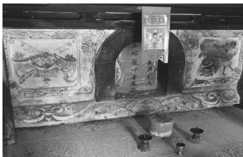
圖 3、客家傳統建築內的龍神