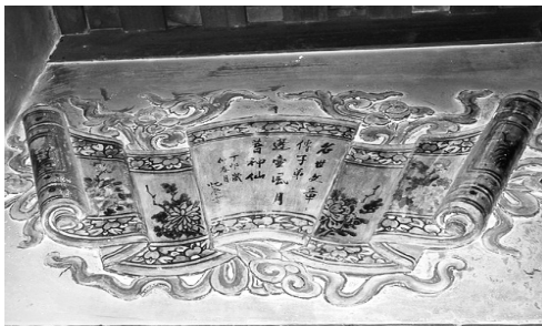
圖 6、萬巒鄉五溝村萬成祖堂： 書卷彩繪 資料來源：本研究拍攝。