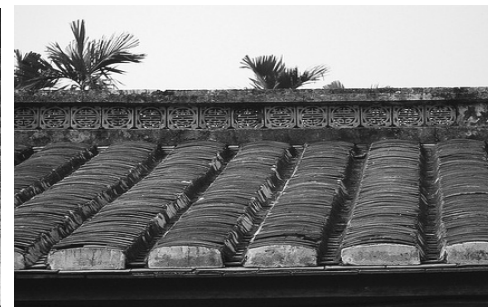
圖 8、萬巒鄉五溝村劉氏宗祠： 壽字花磚屋脊裝飾