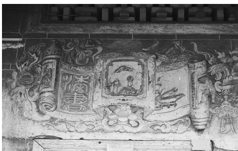
圖 7、麟洛鄉麟蹄村邱屋： 泥塑 彩繪