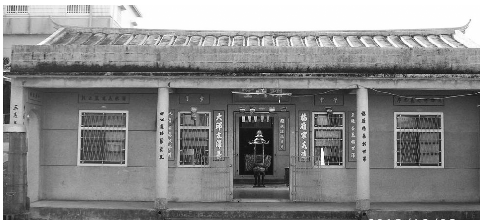
圖 2、客家傳統建築裝飾：書法文字裝飾

客家先民從大陸原鄉渡過黑水溝到臺灣，在地落腳生根，民居建築多以原鄉的形式表現，客家傳統建築裝飾的特色之一即為「文字多」，如麟洛鄉田心村陳屋夥房牆身就有許多書法文字裝飾（圖2）。在六堆傳統的客家民居，仍然遵守傳統客家人建築格局的規範，所謂：「神在廟、祖在堂、人在屋、畜在欄」的規矩 11 ；因此在營造房屋時，採取空間嚴格區別的原則，尤其是做為祭祀空間的祖堂或祠堂，則明顯保存了客家的幾個基本祭祀元素，如與大陸原鄉一樣的「阿公婆牌位」、「龍神」、「化胎」及「五星石」。如萬巒五溝村偉芳祖堂內的龍神（圖3），以及萬巒萬巒村鍾屋祠堂化胎及五星石（圖4）。