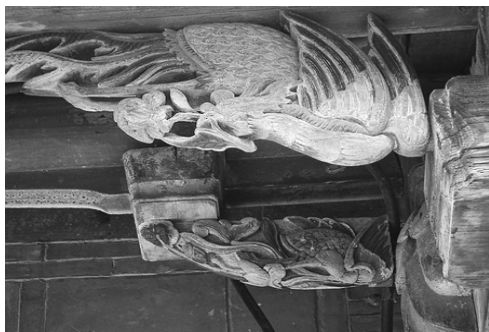
圖 9、萬巒鄉五溝村鍾屋外檐裝飾：木雕彩繪