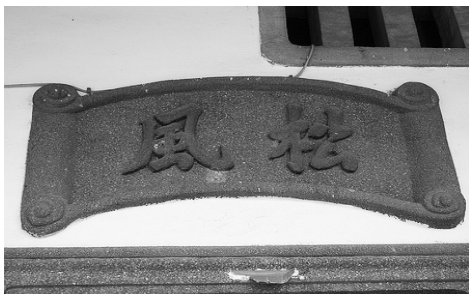
圖 5、萬巒鄉泗溝村張屋： 文字裝飾

臺灣傳統建築屋脊經常施作裝飾，其中最常見的裝飾作法，包括有彩磁、灰塑、剪黏和交趾燒等三種形式。因交趾費時耗工，且需投入大量的資金，故在客家夥房的裝飾上較少見到交趾作品 12 ，而是以柳條花磚、壽字花磚或是剪黏取代交趾燒，達到所謂的「雕花作棟」，如萬巒鄉五溝村劉氏宗祠壽字花的磚屋脊裝飾（圖 8）。