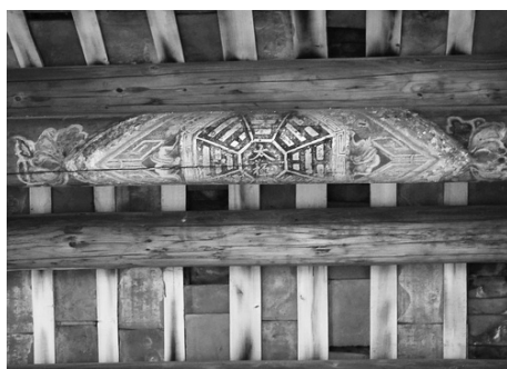
圖 10、萬巒鄉五溝村萬成祖堂：八卦彩繪