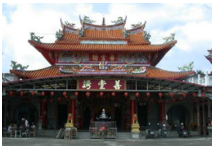
3-5 右堆美濃中壇善誘堂