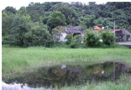
3-6 右堆美濃九芎林宣化堂