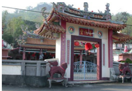
3-3 右堆美濃廣興善化堂