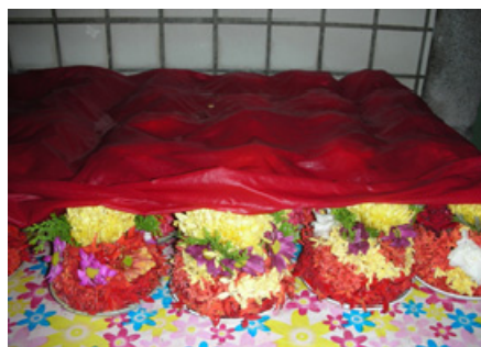
4-12 麟洛開明堂婦女準備花枝花盤供奉