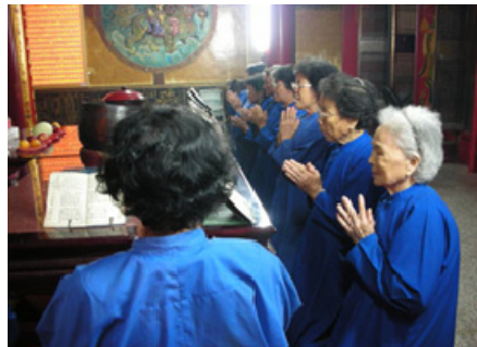
4-6 杉林月眉公明宮經生誦經