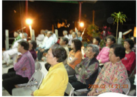
4-2 高樹感化堂於扶鸞後即刻宣講