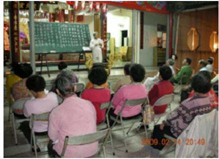
4-4 高樹感化堂魚堂外宣講