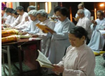
4-8 高樹感化堂婦女誦經