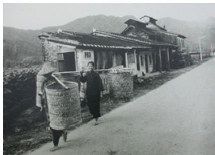
4-15 廣善堂 1962 年挑字紙聖蹟之婦女