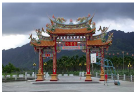
3-8 右堆美濃九芎林聖化宮