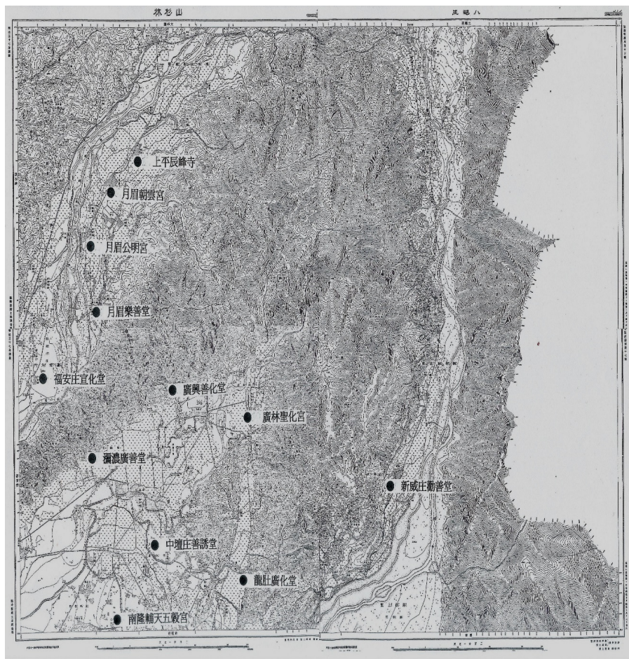
附圖一：六堆高雄客家地區鸞堂分佈圖

資料來源：依據明治 37 年台灣堡圖改繪。〈1904 明治 37 年《臺灣堡圖》，台灣日日新報社出版，遠流出版公司複製發行，1996。〉