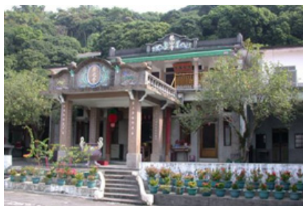
3-4 右堆美濃龍肚廣化堂