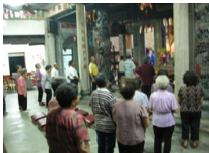
4-7 內埔勸化堂扶鸞婦女於堂外恭迎