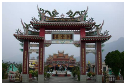
3-1 右堆杉林月眉樂善堂