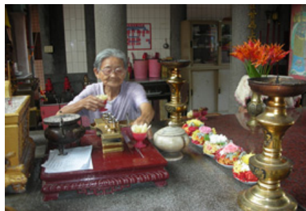
4-10 麟洛開明堂婦女以花枝花盤供奉