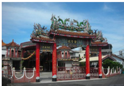
3-13 左堆內埔勸化堂門樓