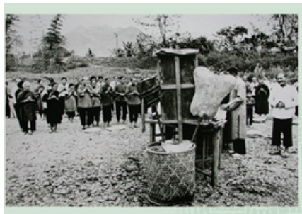
4-13 廣善堂 1962 年恭送聖蹟之婦女