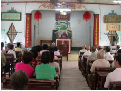
4-1 美濃廣善堂於宣講堂宣講