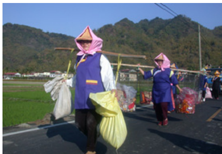
4-16 廣善堂 2016 年挑字紙聖蹟之婦女