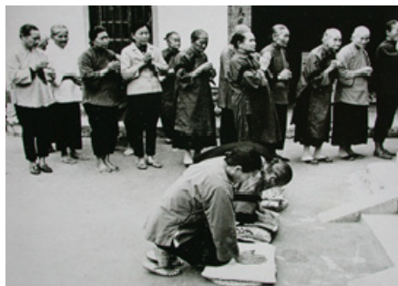
4-14 廣善堂 1962 年恭送聖蹟之婦女