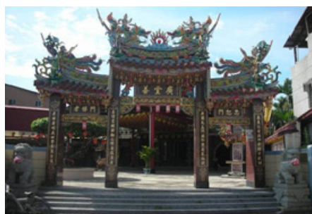
3-11 先鋒堆萬巒廣善堂