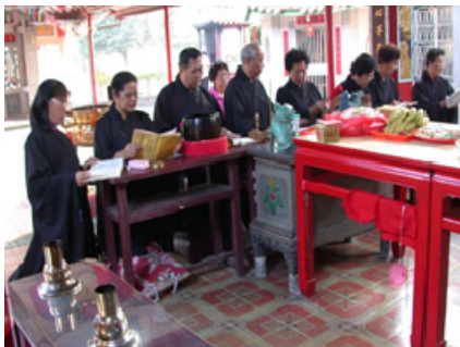
4-5 美濃廣善堂經生班誦經