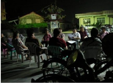
4-3 杉林朝雲宮於堂外宣講