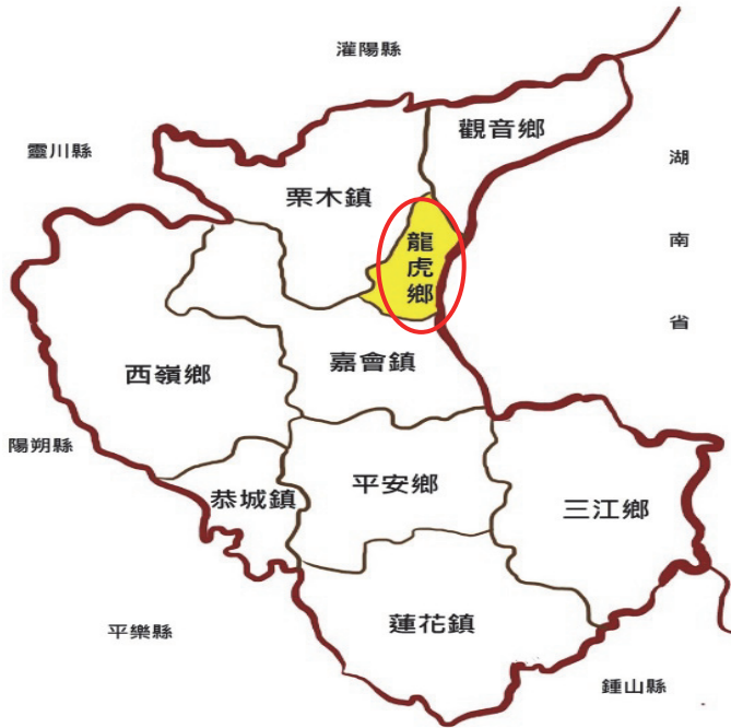
圖 2 廣西恭城縣龍虎鄉地理位置圖

根據《恭城縣志》(1992)一文所記載，龍虎鄉地處恭城縣東北部與湖南省江永縣粗石交界。民國 18 年龍虎關湖南省所轄之湖南街及黃沙灣劃歸恭城縣九板鄉。解放後，龍虎街全部改屬於嘉會區。1958 年 1 月曾建龍虎鄉，同年 9 月併入嘉會公社。1961 年又劃為龍虎公社，次年下半年重歸嘉會區(鄉)。1989 年 10 月，再次將嘉會鄉之龍虎、獅子及栗木鎮之龍嶺、源頭共 4 個村劃為龍虎鄉。恭城縣地理位置如圖 2 所示 4 ：