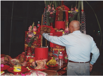
照片 9：美濃下庄滿年福拜天公上下桌