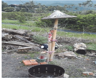
照片 8：旗山雞油腳界址的「符神」