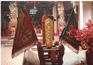
照片 3：西勢玉清宮覺善堂正殿前供奉五營令旗