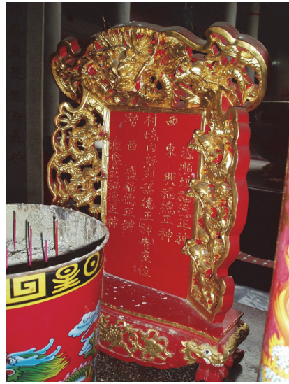
照片 2：西勢玉清宮覺善堂供奉眾伯公