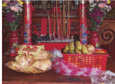
照片 10：美濃下庄滿年福請伯公(香爐內紅紙竹片)