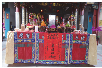
照片 4：2018 年農曆元月九如三山國王廟恭祝王爺奶奶聖誕千秋