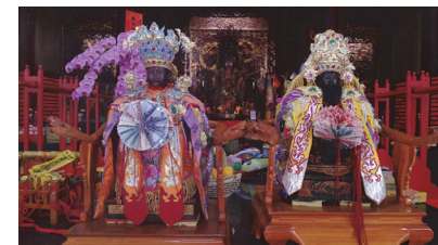
照片 6：2018 年農曆元月二日王爺奶奶回家駐駕麟洛福聖宮