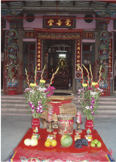
照片 1：西勢玉清宮覺善堂