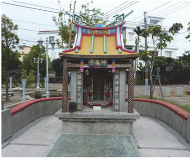
照片 7：佳冬神兵亭有五營兵將守護