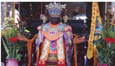
照片 5：九如三山國王廟之王爺奶奶