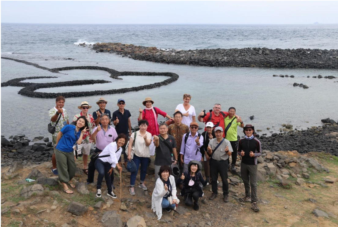
2023 石滬保存維護國際研討會邀請國際學者現勘澎湖七美雙心石滬。

2023 石滬保存維護國際研討會是石滬永續的重要里程碑，為國際學者和民眾提供一個共同交流和分享的平台，不只有助於加強石滬文化的保存與傳承，更確保珍貴的石滬能得到應有的關注和保護。未來也將持續推廣石滬保存，守護活的文化資產。